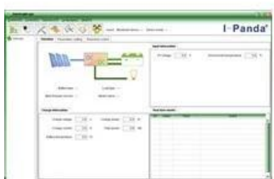
Upper Computer Software