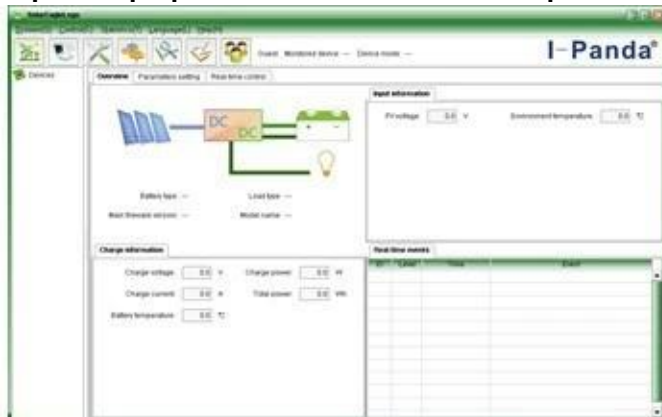
The interface of upper computer software working state