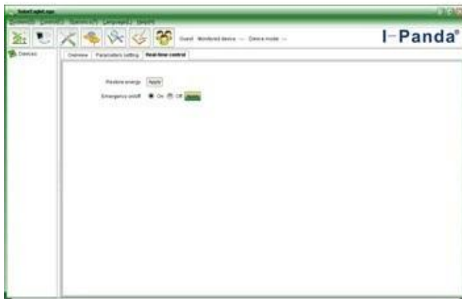
Upper computer software on/off interface and generating capacity record clean interface