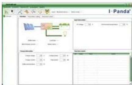
Upper Computer Software