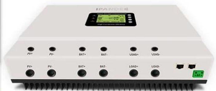
Diagrama de conexão do sistema