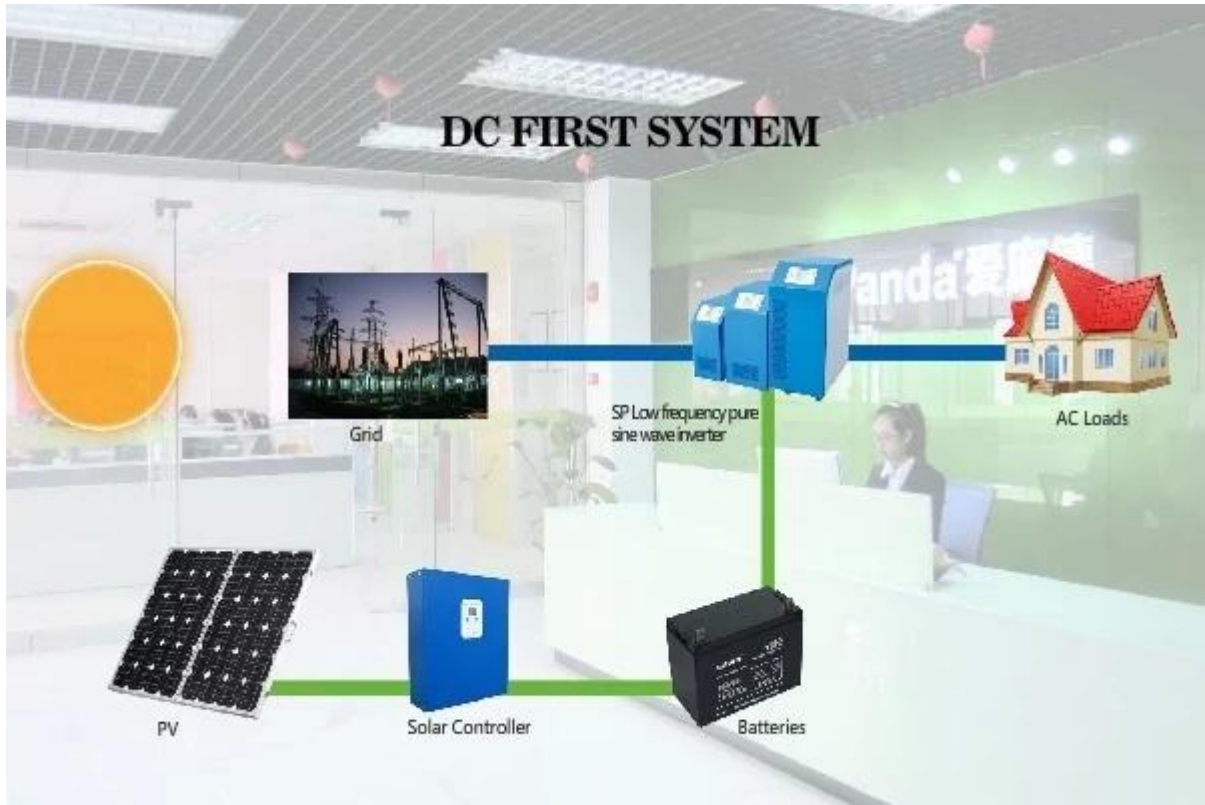
sistema de iluminação solar