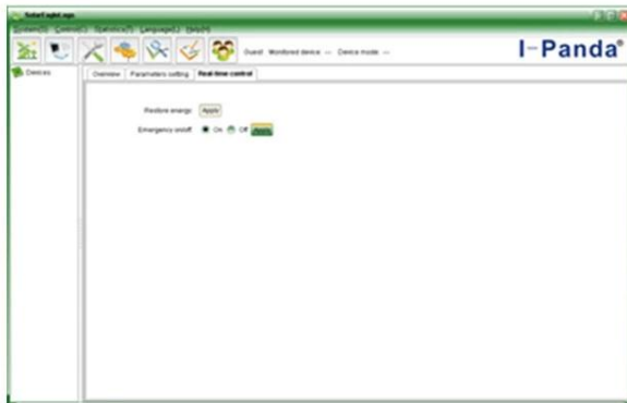
Upper computer software on/off interface and generating capacity record clean interface