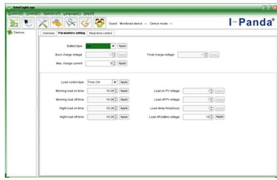
The interface of upper computer software parameter setting state