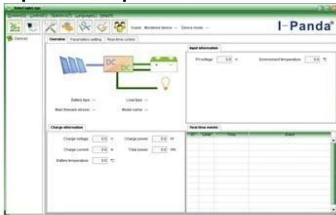
The interface of upper computer software working state