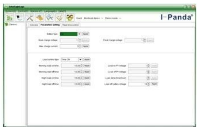
The interface of upper computer software parameter setting state