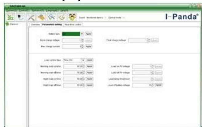
The interface of upper computer software parameter setting state