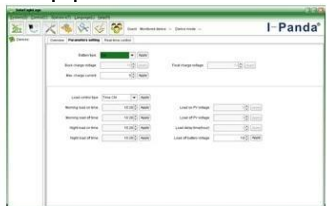
The interface of upper computer software parameter setting state