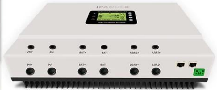
Diagrama de conexión del sistema