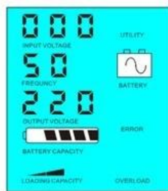
没有市电时为, 逆变为负载供电