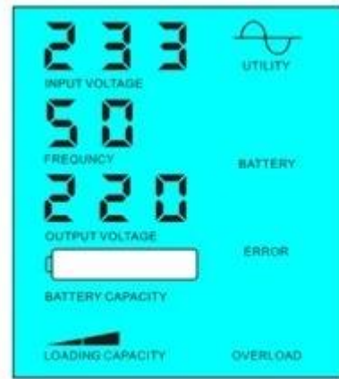
蓄电池没电的时候，由市供电给负载