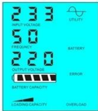
有市电时供电给负载同时为蓄电池充电