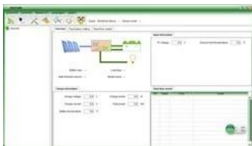
Графический: РС верхняя программного обеспечения тестирование программного обеспечения

1 контроллер РС верхней программного обеспечения и тестирование программного обеспечения может отображать информацию. Пользователи могут установить параметры через РС верхней программного обеспечения.