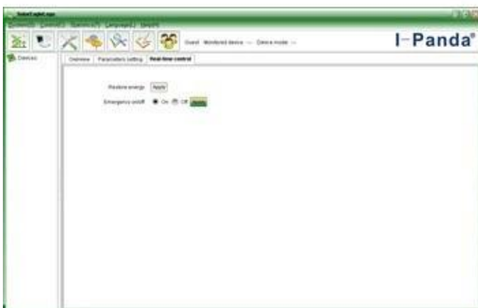
Upper computer software on/off interface and generating capacity record clean interface