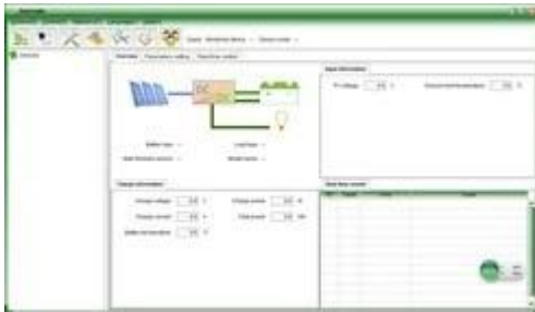
Gráfico: PC software superior

1 Controlador de PC software e teste de software superior pode exibir informações. Os usuários podem definir parâmetros via PC software superior.