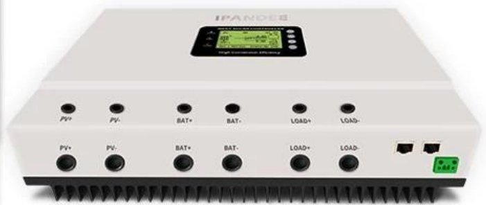
Diagrama de conexão do sistema