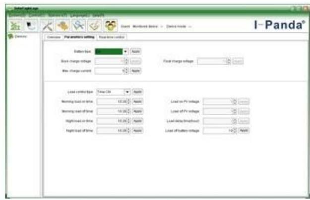
The interface of upper computer software parameter setting state