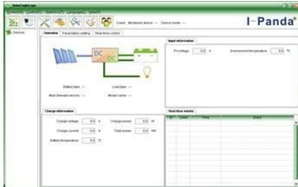
The interface of upper computer software working state