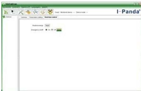
Upper computer software on/off interface and generating capacity record clean interface