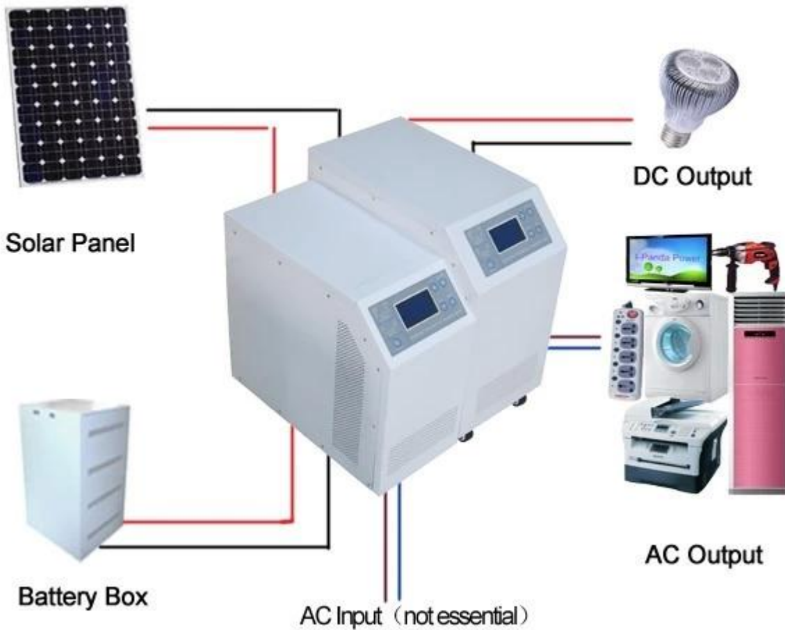
I-P-HPC-Series Inverter+MPPT Solar Controller