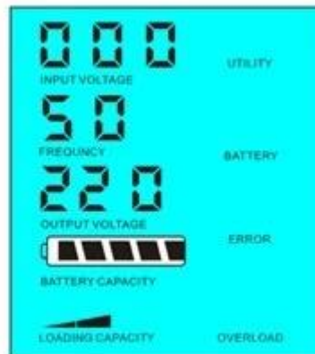
Load's power > 5% of inverter's rated power