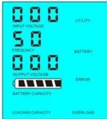
Load's power < 5% of inverter's rated power

1.2 LCD display shows FREQUENCY 50. If the load power is less than 5% of the inverter's rated power, the LCD displays 000 for the output voltage. If the load power is more than 5% of the inverter's rated power, the LCD displays 220 for the output voltage.