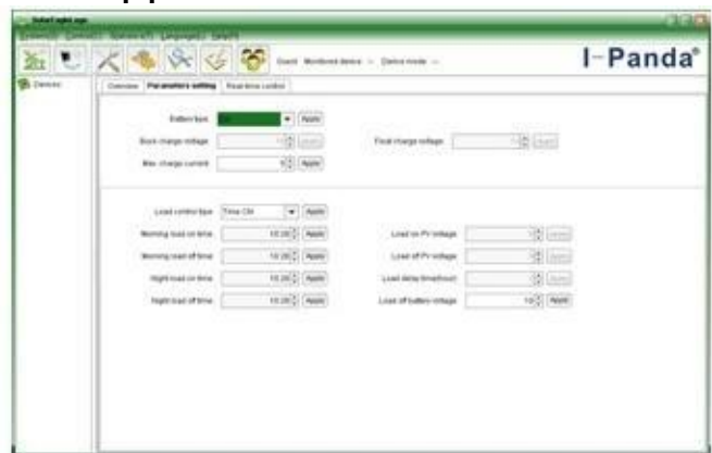
The interface of upper computer software parameter setting state