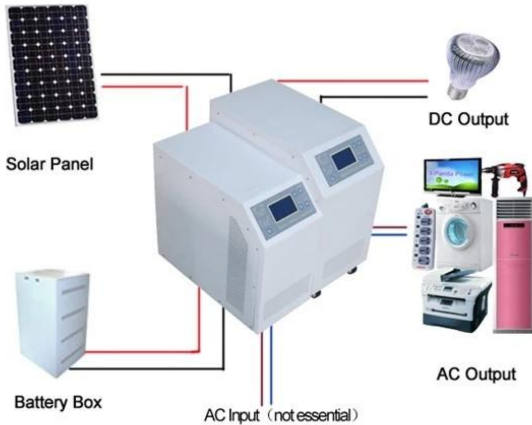
I-P-HPC-Series Inverter+MPPT Solar Controller