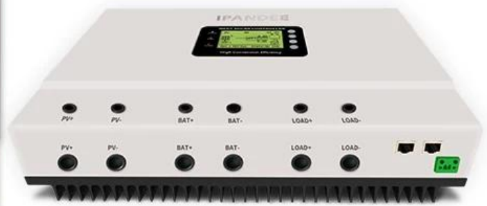
Diagrama de conexión del sistema