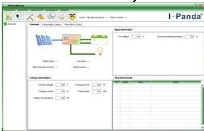
The interface of upper computer software working state