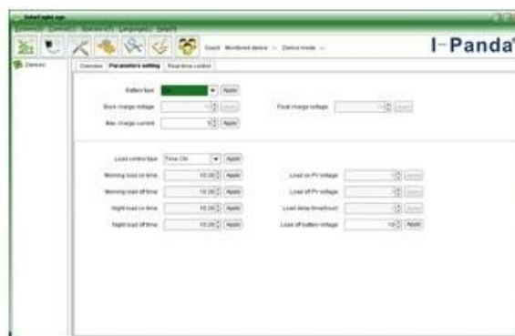
The interface of upper computer software parameter setting state