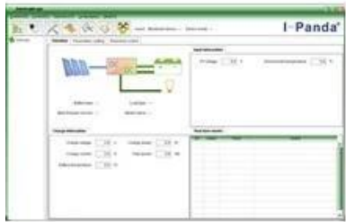
Upper Computer Software