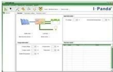
Upper Computer Software