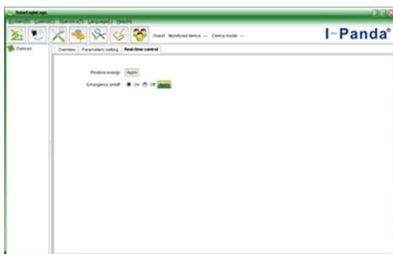
Upper computer software on/off interface and generating capacity record clean interface